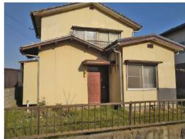
庭木を伐採しました!