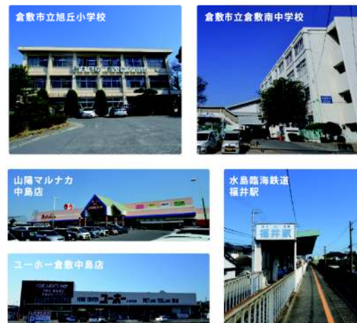
周辺環境撮影年月 2020年3月